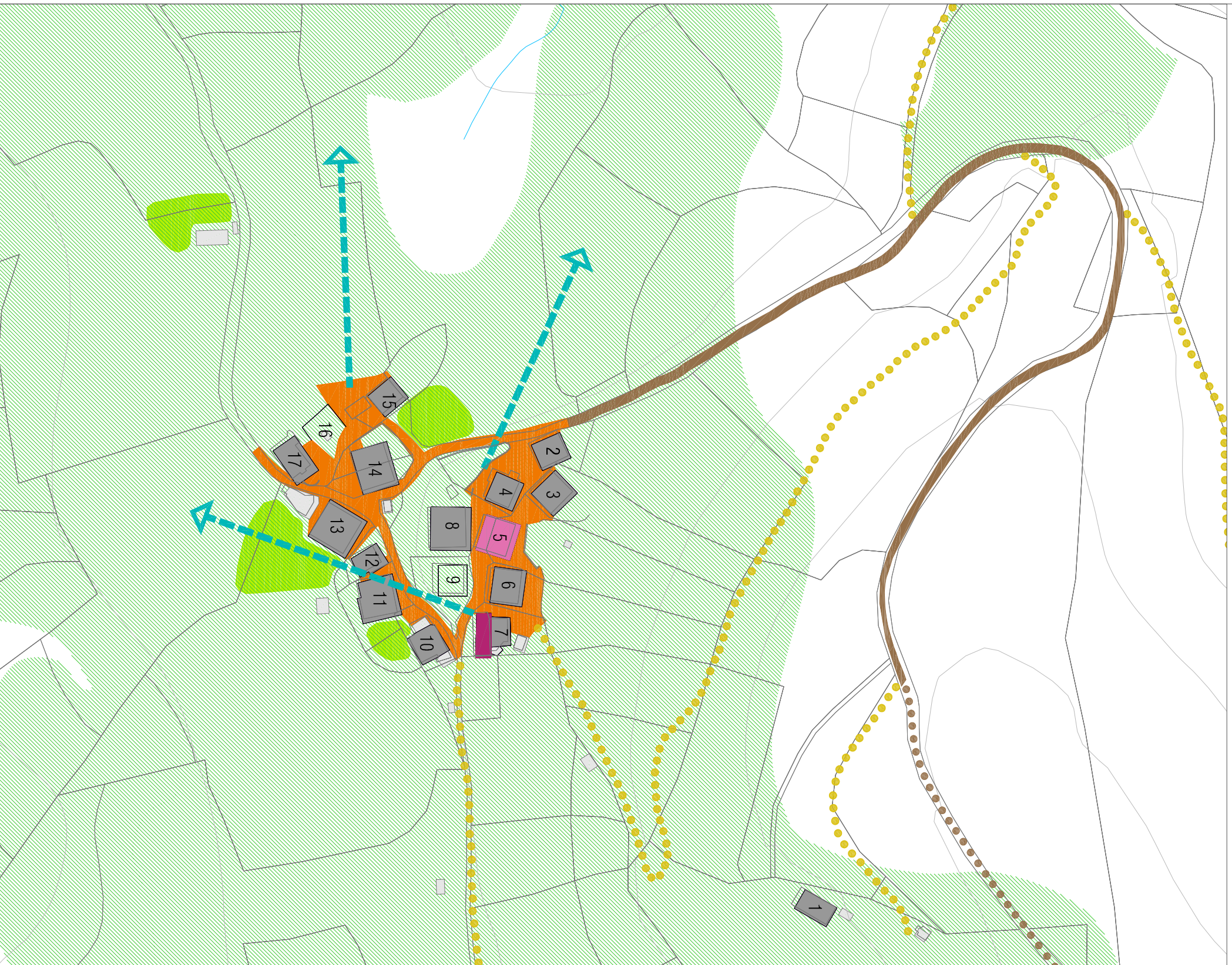
d gure proposamena / nuestra propuesta